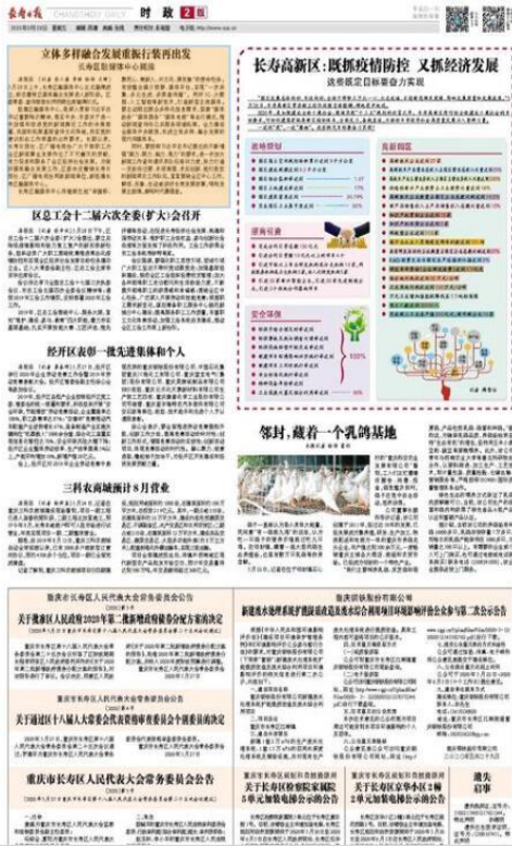
图 3.2-2 报纸公示照片 (2020 年 5 月 29 日)