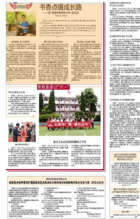
图 3.2-3 报纸公示照片 (2020 年 6 月 1 日)