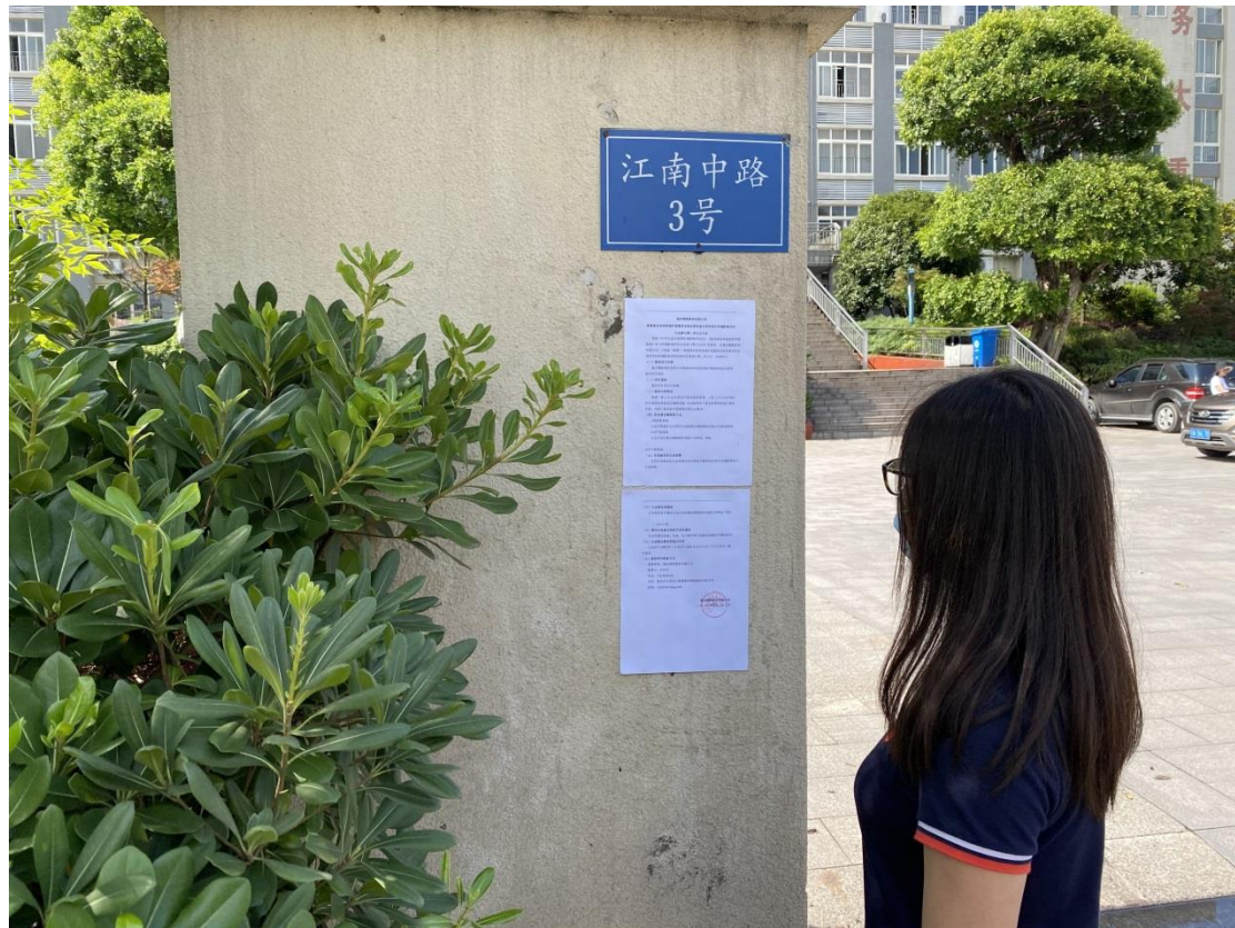
图 3.2-4 张贴板公示现场照片

建设单位于 2020 年 5 月 22 日~2020 年 6 月 4 日在重庆市长寿区江南镇江南中路 3 号进行了公示，现场照片见图 3.2-4~3.2-5。