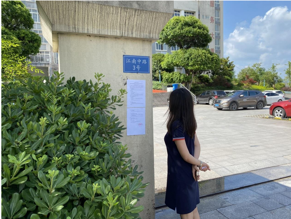
图 3.2-5 张贴板公示现场照片