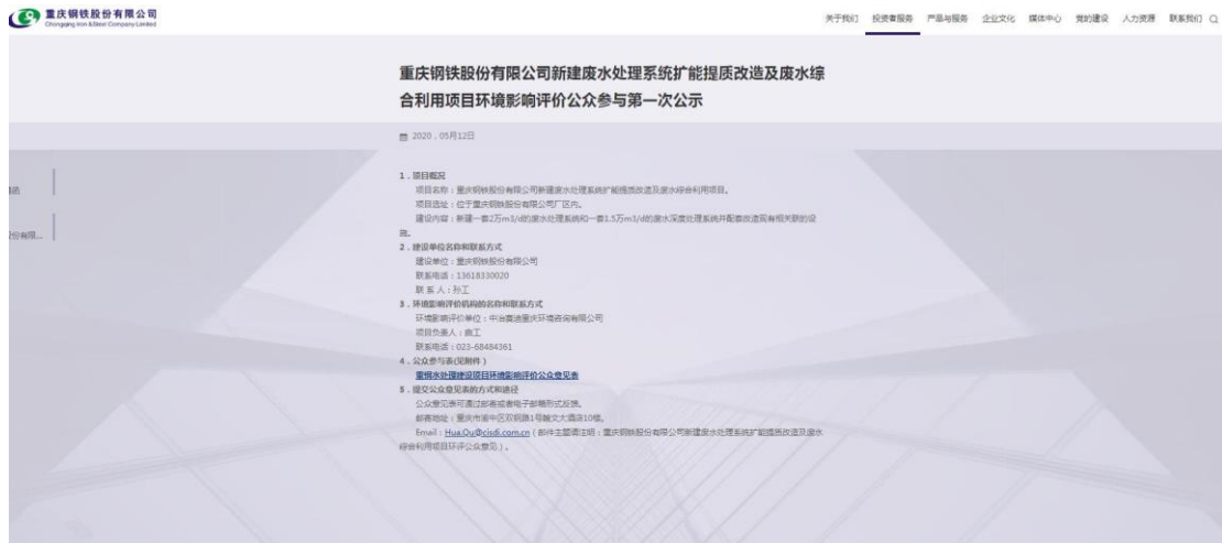
图 2.2—1 第一次公示网页截图

按照《办法》有关规定，建设单位于 2020 年 5 月 12 日在重庆钢铁股份有限公司网站进行第一次公告，公告网址为： http://www.cqgt.cn/news_detail.aspx?t=9&ContentID=1988&page=2 ，公示照片见图 2.2—1。